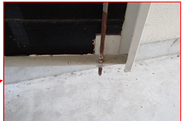
ドア裏面・下部拡大