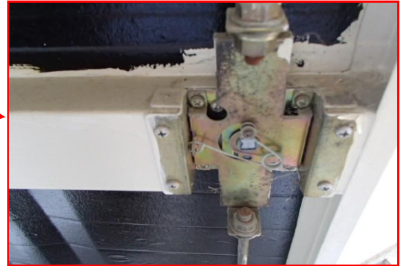
ドア裏面・ハンドル部拡大